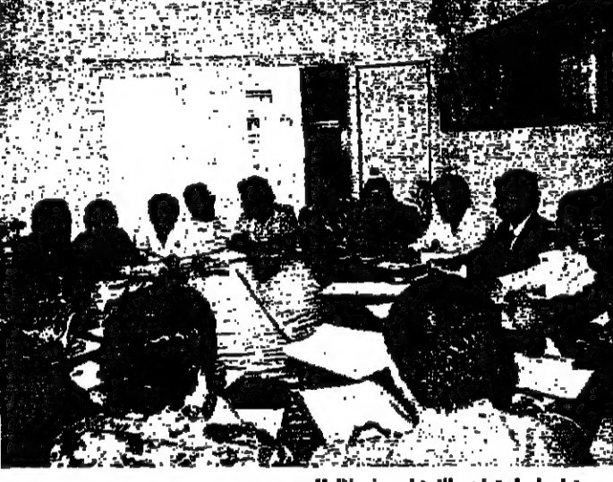
مجلسا لاجتماع الاحزاب خلال الحرب

هذا على الصعيد اليساري والبحث ، اما على الصعيد العربي ، فان ترميم